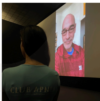
JEAN-MARC BARR Acteur le Grand Bleu

Les "Zoom" pour réduire les distances plusieurs fois dans l'année, les calédonien.nes échangent avec les réalisateurs / acteurs / producteurs autour des films emblématiques sur les thématiques écologiques-RSE.